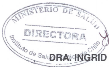
DRA. INGRID HEITMANN GHIGLIOTTO DIRECTORA INSTITUTO DE SALUD PÚBLICA DE CHILE

El mecanismo por el cual el ISP evaluará la calidad del servicio entregado, será por medio de encuestas de Satisfacción al Cliente/a, Usuario/a y Beneficiario/a, periódicamente.